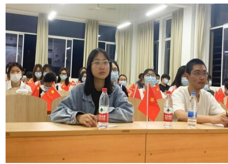
▲团日活动有序进行